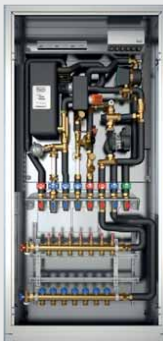
■ Trinkwasserbereitung/ Einbindung von Flächen- Heizsystemen/ Trinkwasserzirkulation