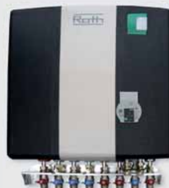
■ Basismodul in EPP-Dämmschale