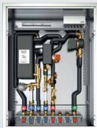
■ Trinkwasserbereitung/ Trinkwasserzirkulation