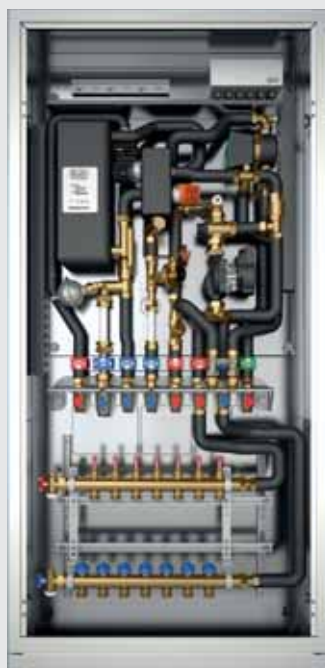
■ Trinkwasserbereitung/ Einbindung von Flächen- Heizsystemen/ Hochtemperatur-Anwendung/ Trinkwasserzirkulation