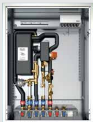
■ Frischwasserstation (Brauchwasser)