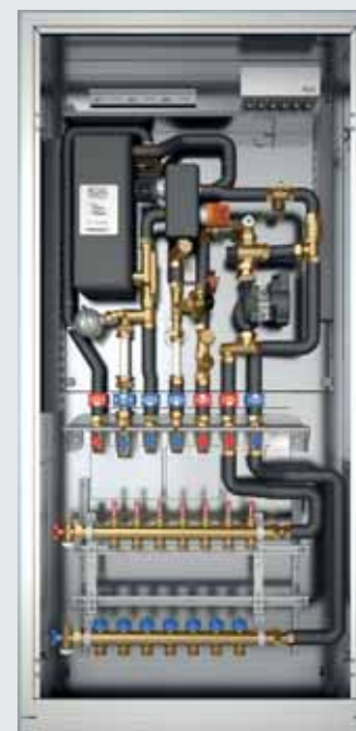
■ Trinkwasserbereitung/ Einbindung von Flächen- Heizsystemen