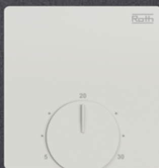
Touchline S Standard