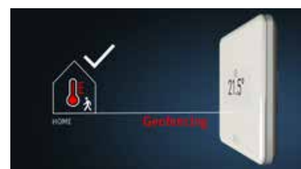
Optional beinhaltet die Roth Touchline S App auch die Funktion Geofencing