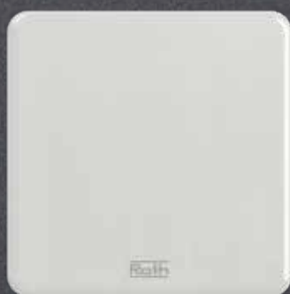
Touchline S Sense