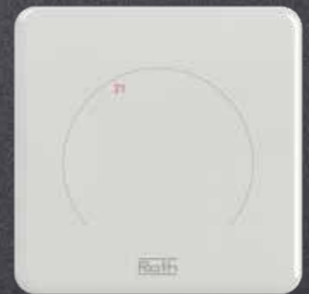
Touchline S Slide