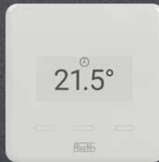
Touchline S Smart