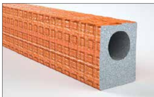
Roth Dämmhülse-FHS 18x9 aus einer exzentrisch extrudierten Rohrisolierung, die aus geschlossenzelligem Polyethylen hergestellt wird und mit coextrudierter PE-Schutz-Folie versehen ist.

Die Anforderungen an Wärmedämmung und Trittschallschutz werden durch die Roth System-Verbundplatten oder Verbundrollen, in Kombination mit der Ausgleichsschicht oder der Zusatzdämmung erfüllt.